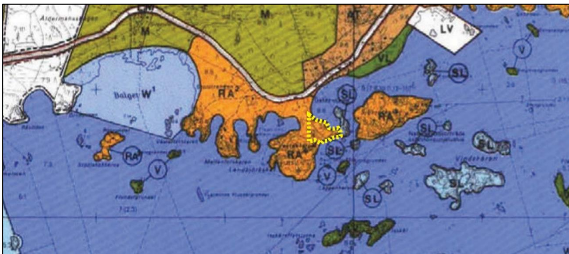
Kuva 6: Ote rantayleiskaavasta. Ranta-asemakaava-alueen suurpiiteinen raja on merkitty keltaisella katkoviivalla. Kartta: Hangon kaupunki, Karttapalvelu 21 .

Hangon kaupunki on vuodesta 2010 lähtien noudattanut ympäristölautakunnassa käsiteltyjä mitoitusnormeja ranta-asemakaavoissa. 20 Torskären I ja Torskären II ranta-asemakaavassa tehty emätilamitoitus pohjautuu ympäristölautakunnan käsittelemiin normeihin. Eriksson udden tilat kuuluvat samaan emätilakokonaisuuteen Torskären kaavassa tarkasteltujen tilojen kanssa. Emätilamitoitus on esitetty selostuksen liitetaulukossa 3: Mitoitus-taulukko.