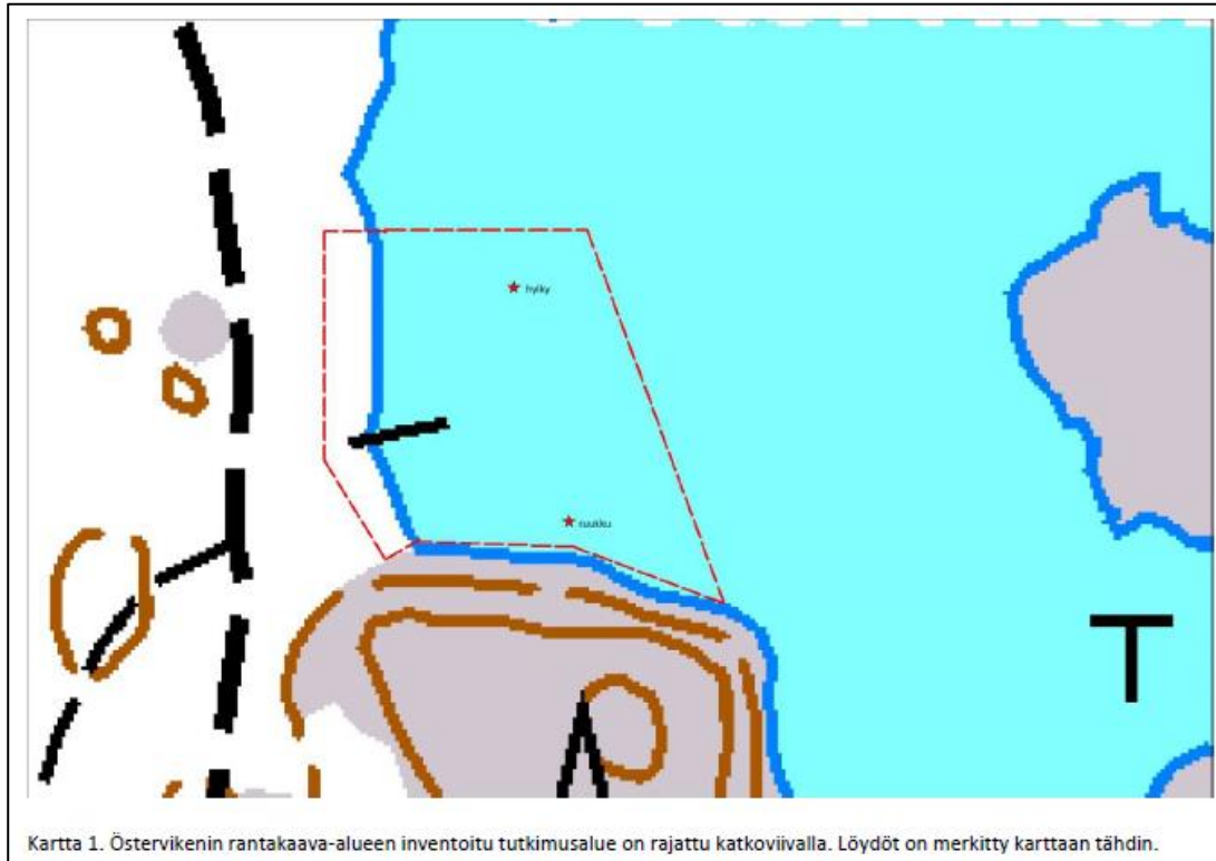
Kuva 4: Vedenalaisen arkeologisen inventoinnin kartta 1 (Museovirasto 2013). 11

Suunnittelualueelle ei sijoitu kulttuurihistoriallisia kohteita eikä muinaismuistoja tai muinaisjäännöksiä. Pohjoisemman kiinteistön edustalla vesialueella, joka ei kuulu kaava-alueeseen, sijoittuu vedenalaisia muinaisjäännöksiä. 9 Naapurikiinteistön puolelle sijoittuvan laiturin läheisyydestä löytyi hylky ja kaava-alueen pohjoisemman kiinteistön edustalta ruukku. 10