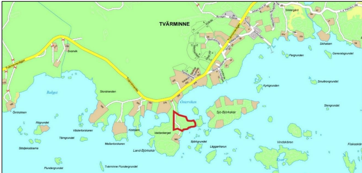
Kuva 2: Kaava-alueen sijainti.

(RA-tontti). Erikssons udden tilat kuuluvat samalle maanomistajalle. Kaava-alueen sijainti on esitetty kansikuvassa sekä kuvissa 1 ja 2.