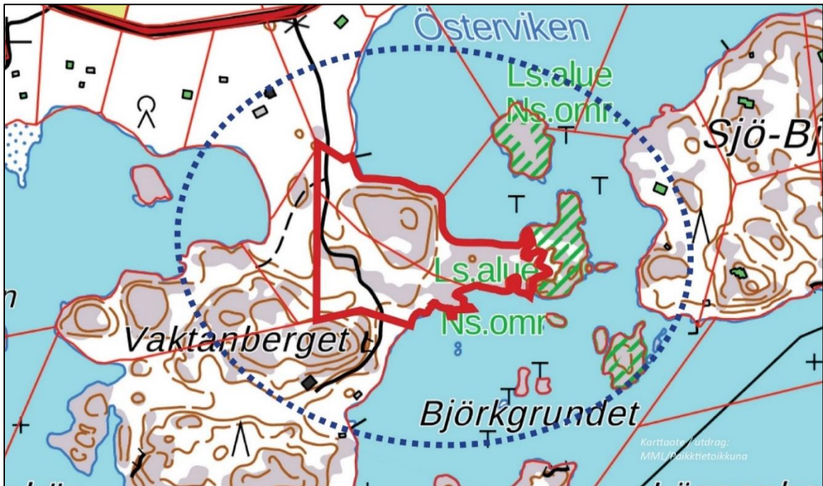
Kuva 1: Suunnittelualaue on merkitty karttaotteeseen punaisella rajauksella ja lähivaikutusalue sinisellä katkoviivalla.

Kaava-alue sijaitsee Hangossa Tvärminnen kylässä. Alue sijoittuu Vaktanberget -nimisen niemen koillisosaan osoitteeseen Tvärminnentie 388 ja 390. Tvärminnen kyläkeskus sijoittuu kaava-alueesta koilliseen. Matkaa Hangon keskusta on noin 14 km.