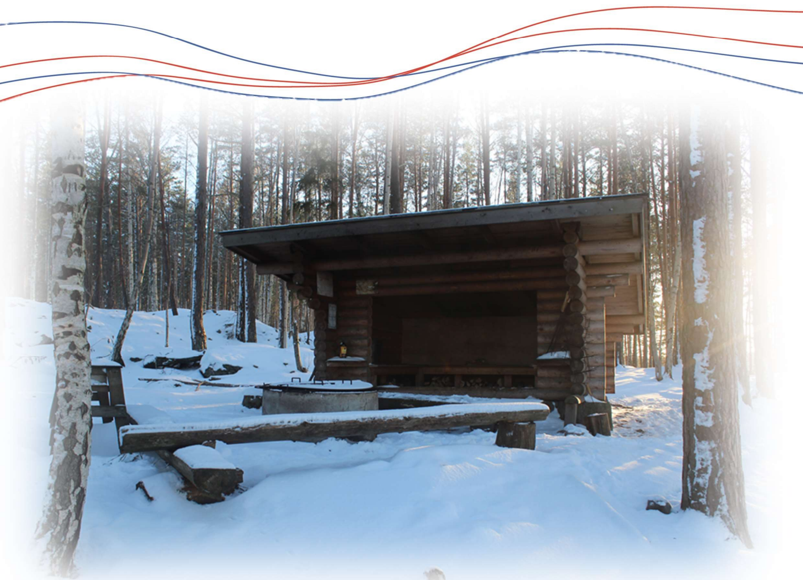
Laavut ja grillipaikat