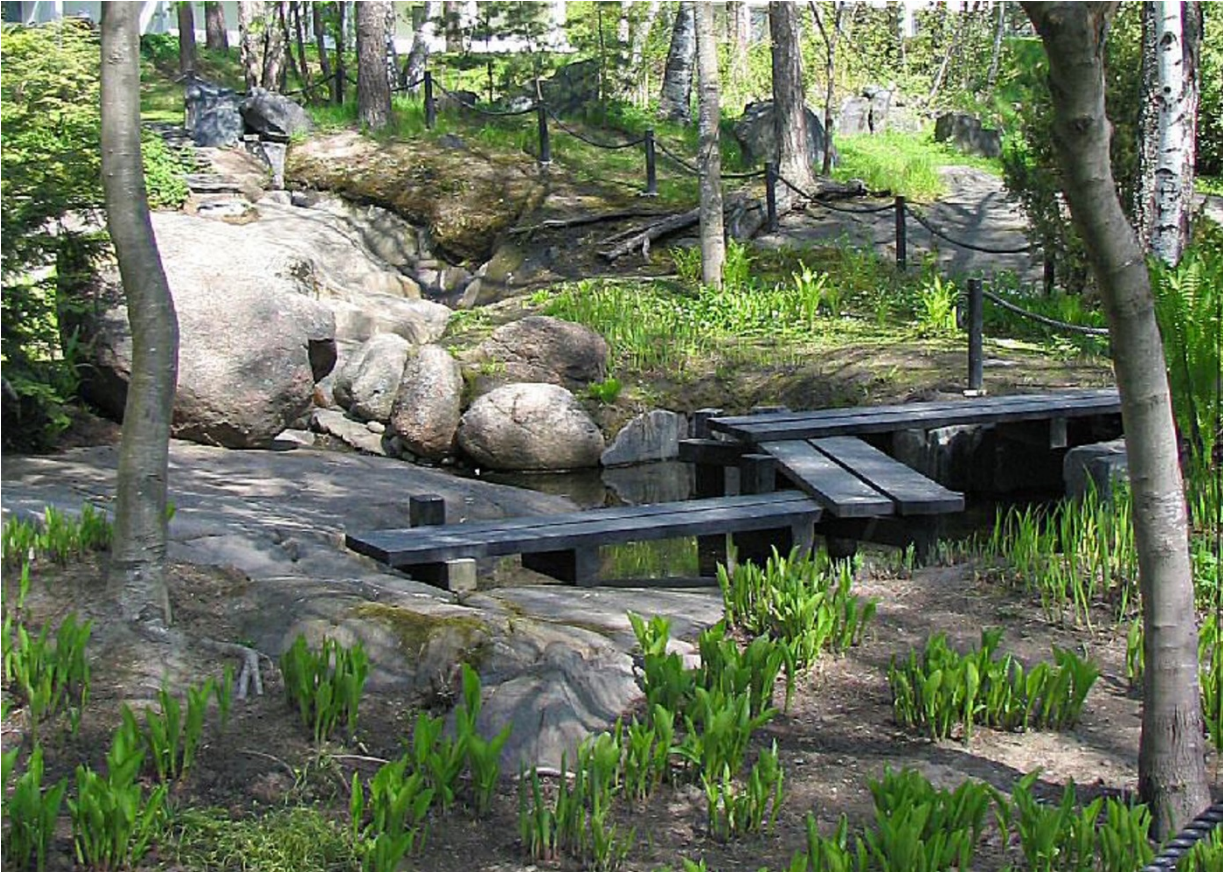
Kuvia 8, 9 ja 10 erilaisista puistoelementeistä

Puiston luoteisosaan rakennetaan matala vesi- tai kiviallas, jossa on Japanilaistyylliset puiset astinlankut. Allas koristellaan luonnonkivillä ja erilaisilla puistoon sopivilla kasveilla.