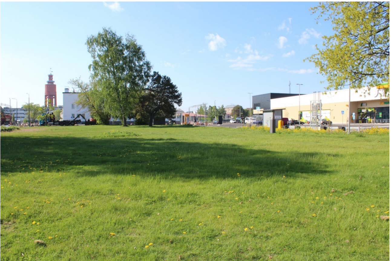
Kuva 1. Asematorin kuva 2024 keväällä

Asematorilla on tällä hetkellä avoin pelkistetty puisto, jossa on muutama penkki, matala perennojen istutusalue, puita ja nurmikkoa. Asematorin puiston reunoilla kasvaa kymmenisen isompaa puuta. Palokunnankadun puolella kasvaa Isoja koivuja 3 kpl ja Esplanadin puolella 2 kpl isoja tammia. Asemarakennuksen vieressä kasvaa mänty ja muutamia jalopuita, saarnivaahteroita. Kauniit havuistutukset jäivät rakennetun kauppakeskuksen tie- ja paikoitusalueen alle.