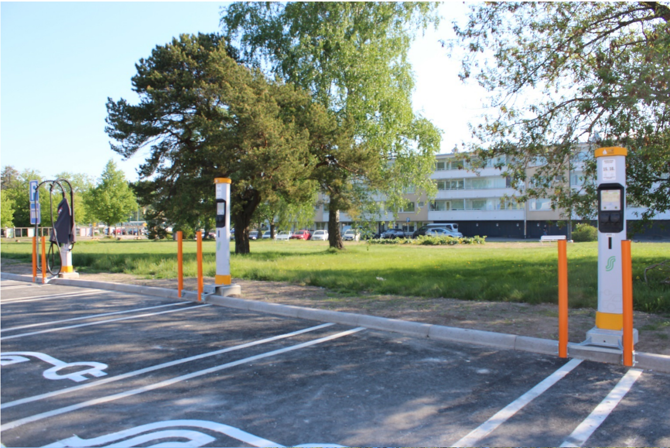
Kuvia 2, 3 Asematorilta