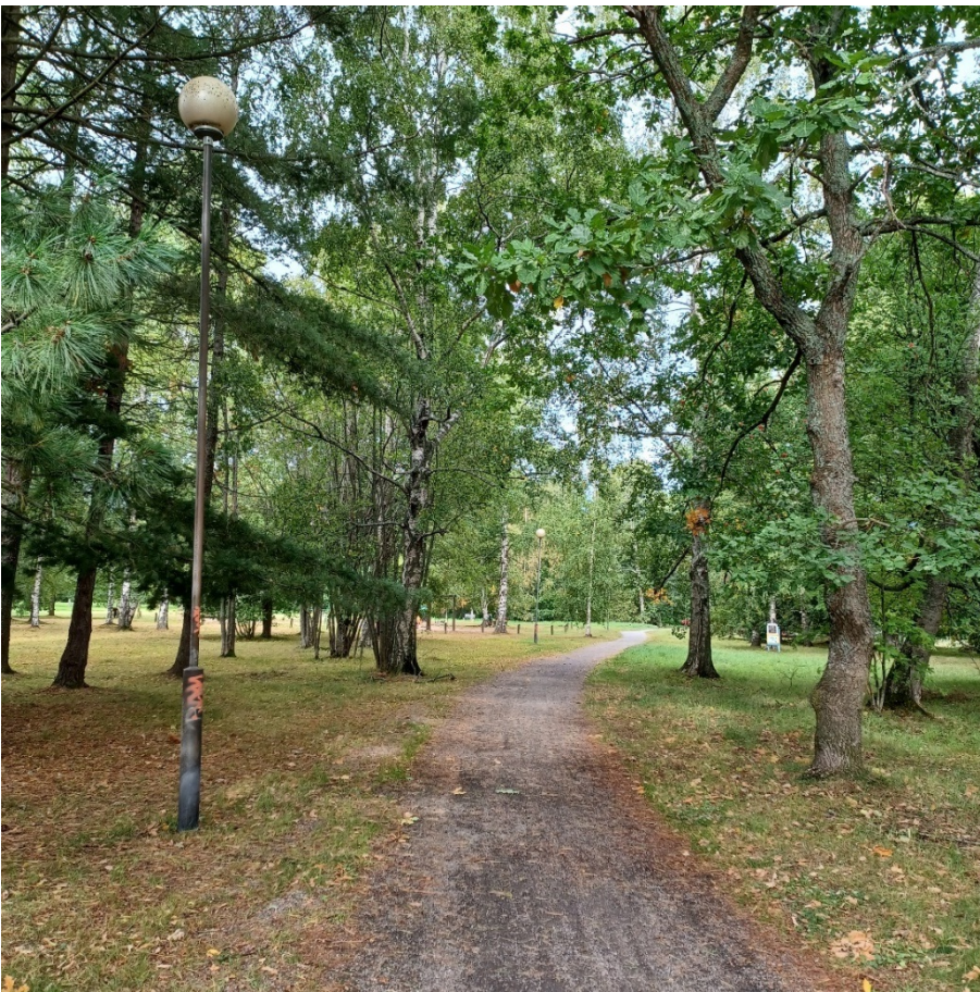
Kuva 3 Haagapuiston kevyenliikenteen väylä syksyllä 2024