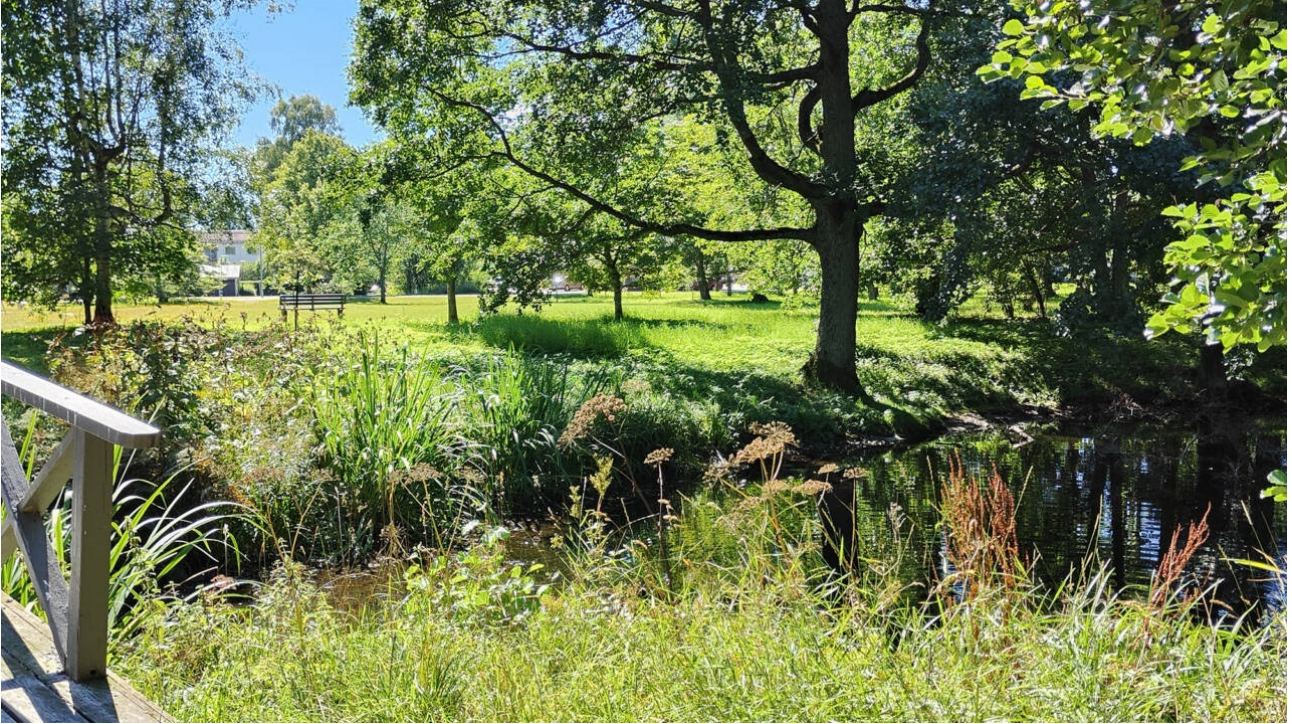
Kuva 1. Haagapuisto 2024 syksyllä