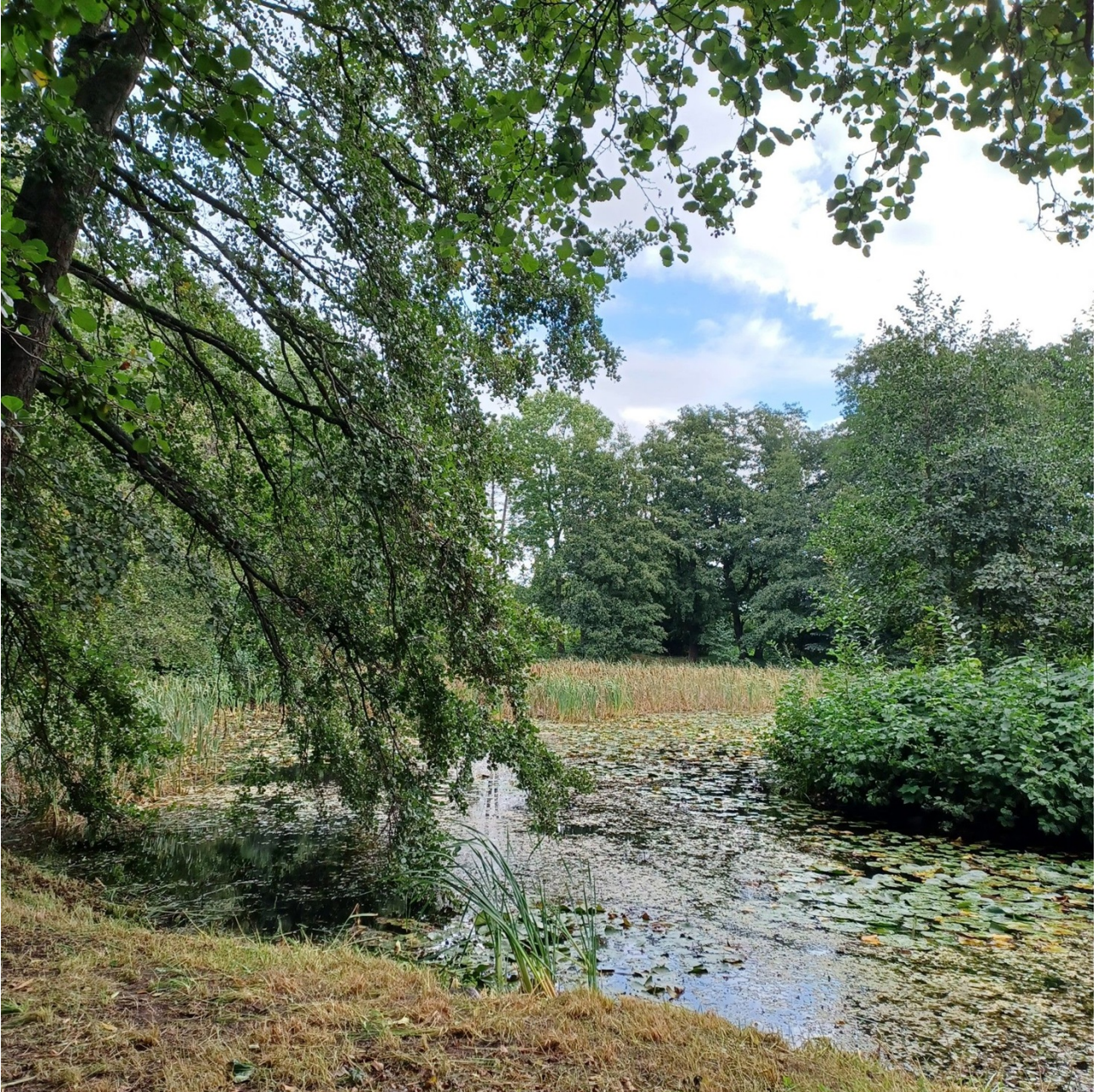
Kuva 2 Haagapuiston lampi syksy 2024