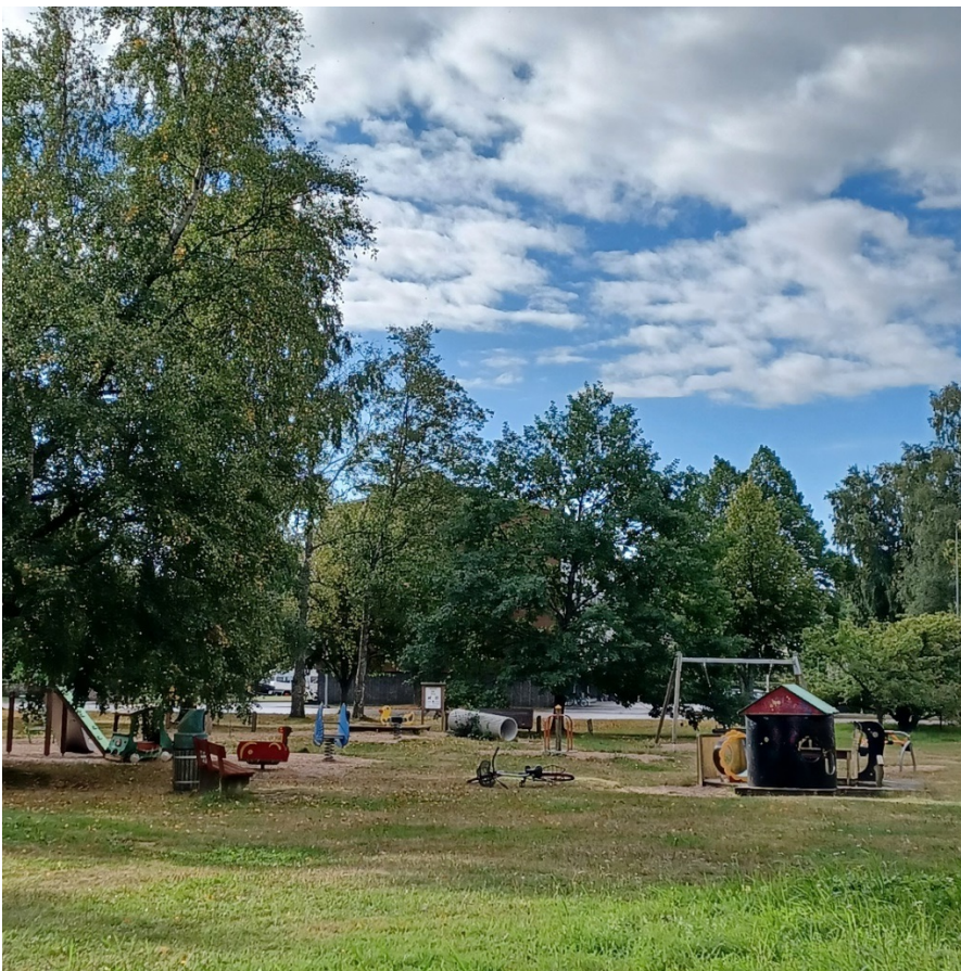
Kuva 4 Haagapuiston leikkipuistoalue syksy 2024