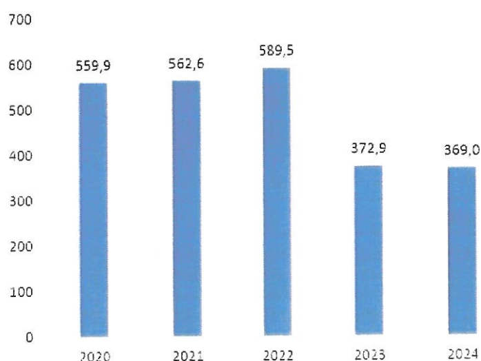
Kuva 4 Henkilötyövuodet 2020–2024 Bild 4 Årsverken 2020–2024

Mätt i årsverken (hela personalen förutom medborgarinstitutets timlärare) har personalresurserna minskat med 3,9 årsverken från föregående år.